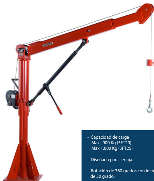
Captain 2000 Series 5FT20