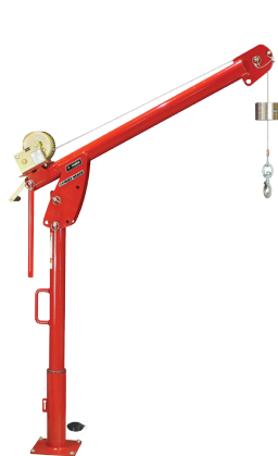
First Mate 500 Series 5PF5