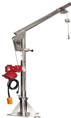
Ensign 1000 Series 5PA10