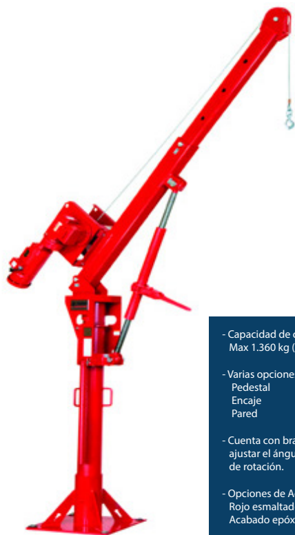
Admiral 3000 Series 5PT30