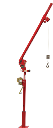
Ensign 500 Series 5PA5