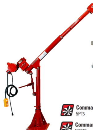
Commander 500 Series 5PT5